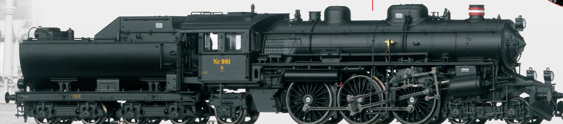
Abbildung zeigt das Modell in Vitrinenstellung mit diversen Ansteckteilen.

All steps are included for a prototypical presentation.